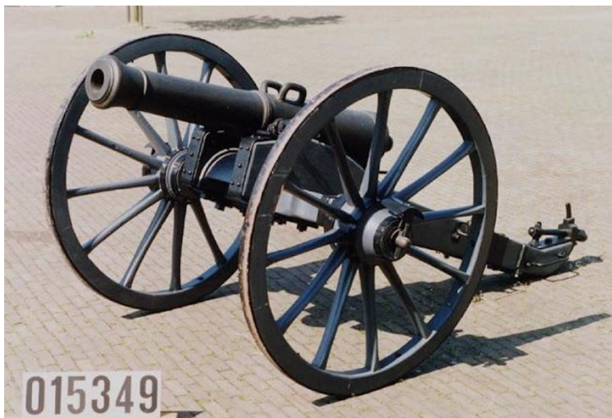
de 6 ponder die bij de Naald in Baarn heeft gestaan zonder voorwagen

Van de oorspronkelijke kanonnen kon Paul van Brakel, de conservator van het huidige Nationaal Militair Museum (NMM) te Soesterberg, mij bevestigen dat het om 6-ponders gaat. Deze twee originele exemplaren zijn in 1926 inderdaad bij het Legermuseum (nu Nationaal Militair Museum) terechtgekomen. Van één exemplaar uit hun collectie is bekend dat deze bij de Naald in Baarn heeft gestaan, mét voorwagen. Dit exemplaar staat momenteel in de opslagruimte van het NMM te Soesterberg. Van een mogelijk tweede exemplaar lijkt deze herkomstinformatie verloren gegaan.