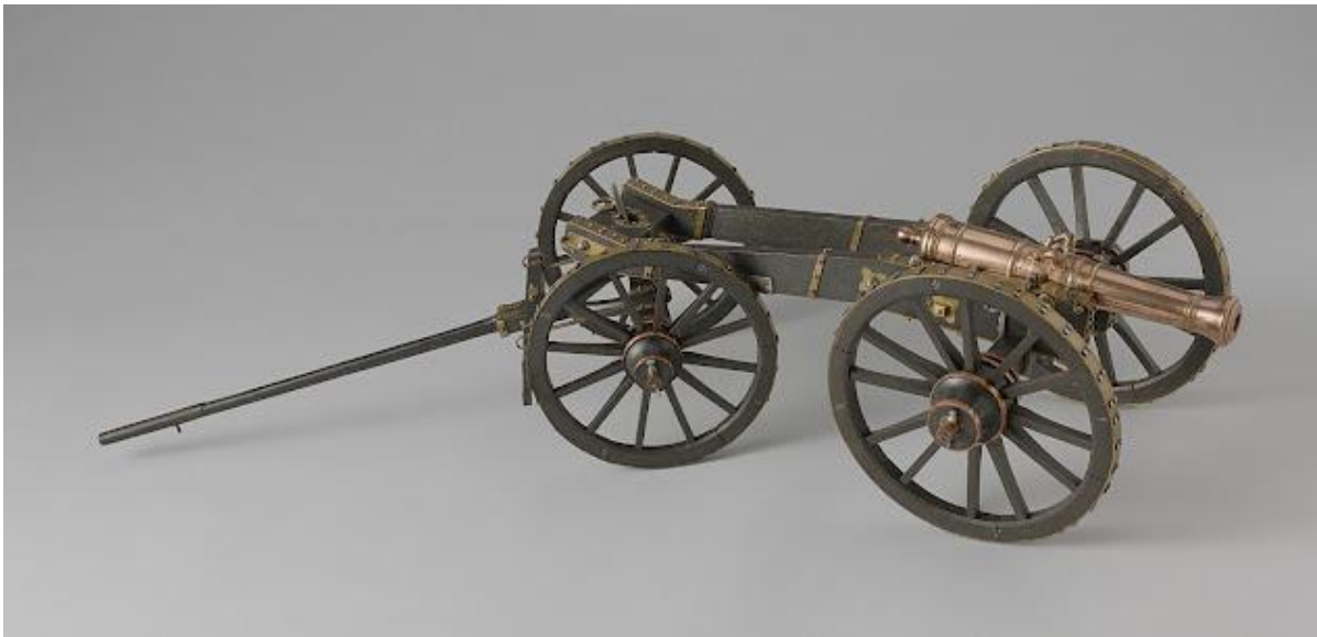
model van een 6 ponder met voorwagen