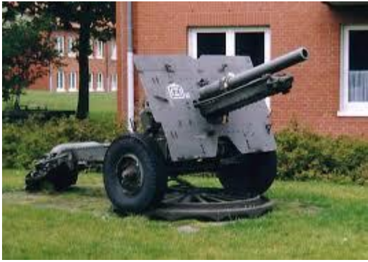
voorbeeld van een 25 ponder