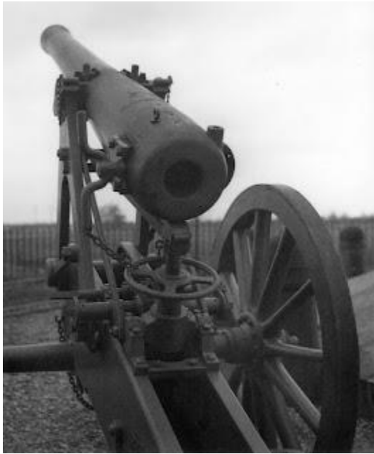
een vestingkanon van dichtbij bij de naald