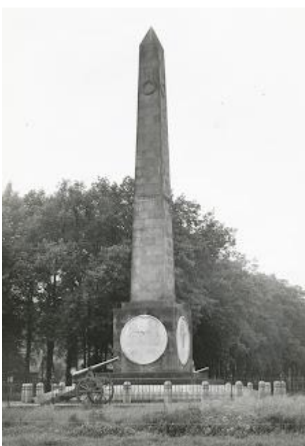
een ander vestingkanon

Ook hebben er in het verleden 2 vesting kanonnen 11 cm gestaan. Deze staan nu opgesteld in de permanente tentoonstelling (paviljoen II) van het Nederlands Artillerie Museum 't Harde (thans omgedoopt tot Historische Collectie Korps Veldartillerie). Bij navraag daar is dit nog eens bevestigd.