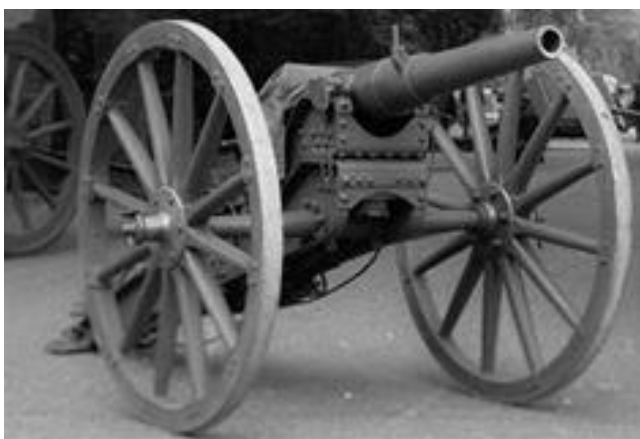
Vestingkanon Ned. Artillerie Museum