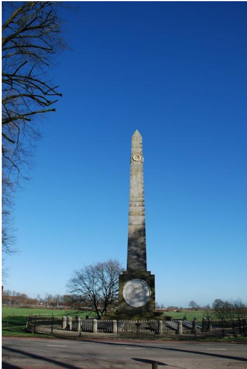
de naald januari 2016 al ruim 17 jaar zonder kanonnen