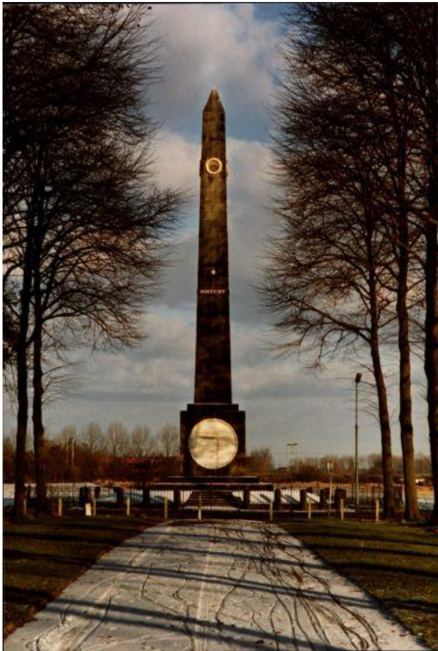
de naald in de sneeuw