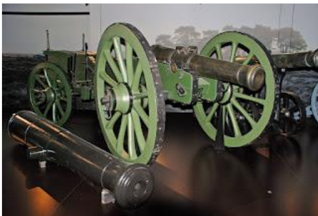
6 pponder met munitiewagen

Het geschut werd geplaatst op een affuit, een onderstel dat veelal was geconstrueerd van iepen- en eikenhout met een smeedijzeren beslag. Gelet op het gewicht van met name kanonnen (een 48-ponder woog veelal 3.458 kilo, een 24 pponder 2.223 kilo, een 12 pponder 1.580 kilo en een 6 pponder 1.037 kilo) werden voor het op- en afladen en het verplaatsen krachtwerktuigen gebruikt, zoals een hijsbok en een triquebal (ook wel mallejan genoemd), een wagen waarmee zware lasten konden worden opgetild en verplaatst. Met enige regelmaat werden hiervoor ook paarden ingeschakeld van boeren uit hun omgeving.