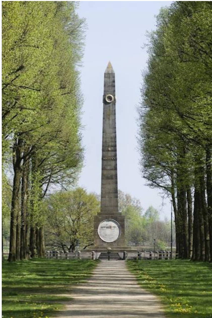
de naald ook weer zonder de kanonnen