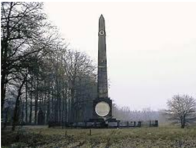
25 ponder naast de Naald