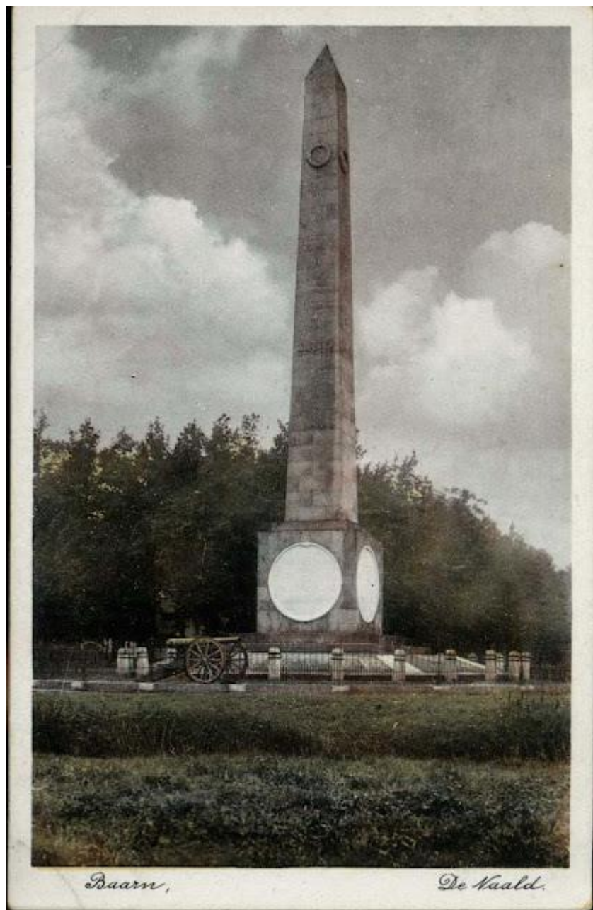
de naald lang geleden