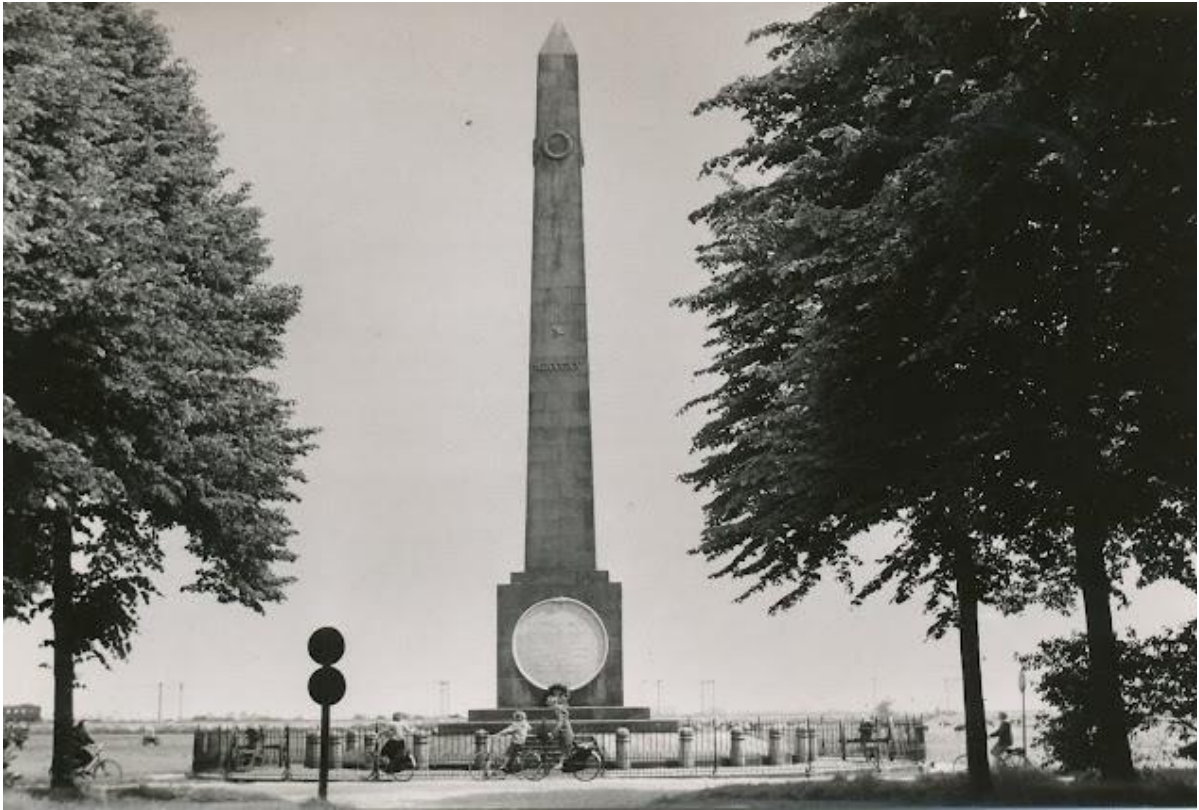
de naald met kanonnen zonder voorwagen